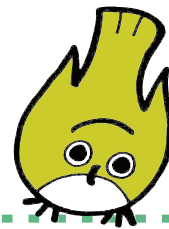
わみなカードのキャラクターメジロー